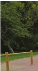
L'aire de jeux inaugurée le 15 septembre