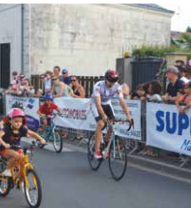
t, de jeunes cyclistes se sont circuit des grands !