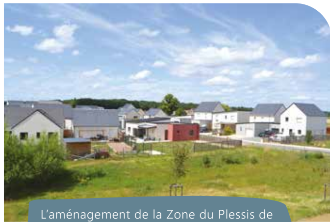
L'aménagement de la Zone du Plessis de Jau se poursuit, alors que s'ouvrent les chantiers des Champs de Mazé et de la Bouchetière.