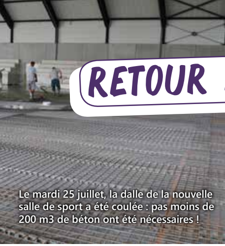
Le mardi 25 juillet, la dalle de la nouvelle salle de sport a été coulée : pas moins de 200 m3 de béton ont été nécessaires !