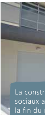
La construction des locaux sociaux a été achevée à la fin du mandat. Une demande de subvention a été déposée.