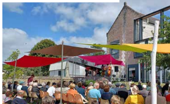
3 concerts des Jardins de musique ont encore accueilli de nombreux spectateurs. Rendez-vous le dimanche 10 septembre pour le dernier de cette saison !