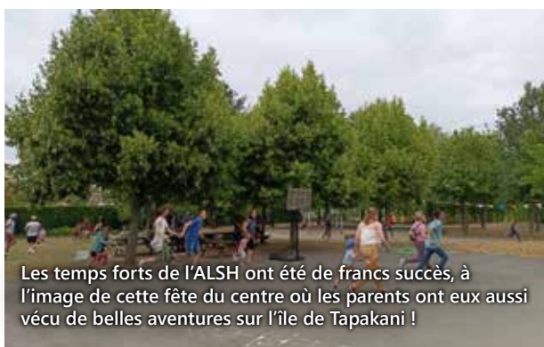
Les temps forts de l'ALSH ont été de francs succès, à l'image de cette fête du centre où les parents ont eux aussi vécu de belles aventures sur l'île de Tapakani !