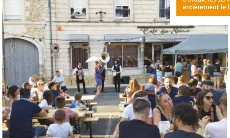
Les Sassy Swingers ont rythmé le repas et le marché nocturne du samedi avant de céder la place au DJ pour la soirée dansante.