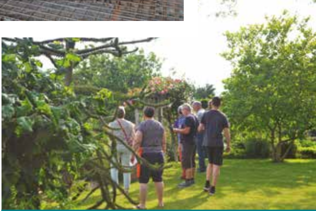
Le jury Mon jardin, ma ville est allé visiter les participants, le samedi 17 juin dernier. La remise de prix aura lieu le vendredi 20 octobre.