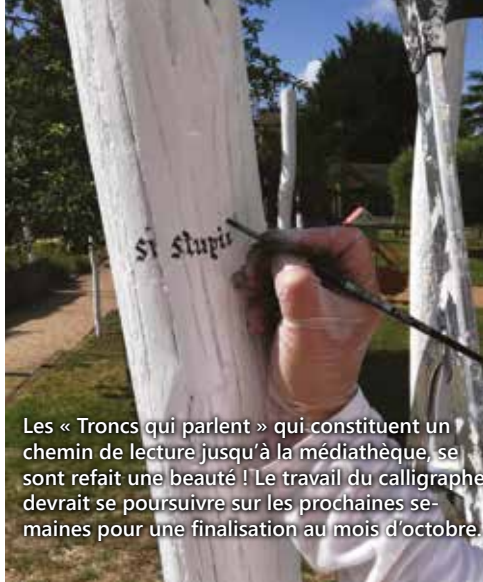
Les « Troncs qui parlent » qui constituent un chemin de lecture jusqu'à la médiathèque, se sont refait une beauté ! Le travail du calligraphe devrait se poursuivre sur les prochaines se- maines pour une finalisation au mois d'octobre.