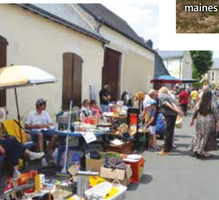
Grâce à l'association Made in Mazé-Mi- lon, le vide-greniers a réinvesti les rues du centre-bourg le dimanche 9 juillet.