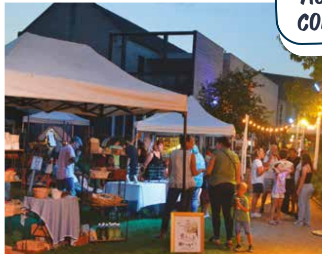
Le samedi, une vingtaine d'artisans ont investi un jardin de l'Apostrophe joliment éclairé pour l'occasion.