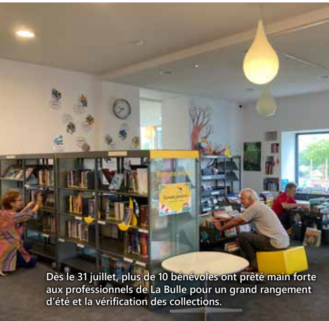
Dès le 31 juillet, plus de 10 bénévoles ont prêté main forte aux professionnels de La Bulle pour un grand rangement d'été et la vérification des collections.