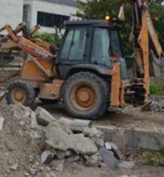
dothèque, située en cœur la mi-juillet. En parallèle des niques municipaux ont démonté si se situait sur le même terrain.