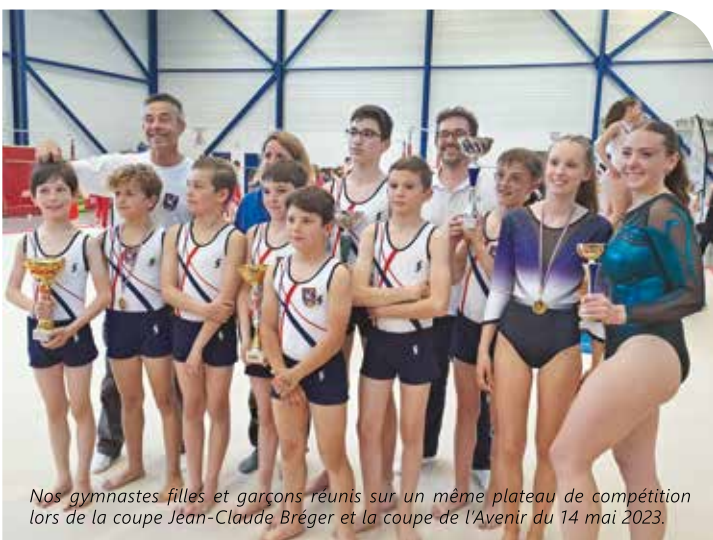
Nos gymnastes filles et garçons réunis sur un même plateau de compétition lors de la coupe Jean-Claude Bréger et la coupe de l'Avenir du 14 mai 2023.

Les dernières en date sont les aînées et les jeunes qui ont participé les 24 et 25 juin au championnat national par équipe à Flers (61) avec des résultats très honorables. Les aînées ont même terminé 3e ex-aequo au mouvement d'ensemble, agrès spécifique aux catégories féminines qui consiste à réaliser en équipe une succession de mouvements imposés de manière parfaitement synchrone. Avant elles, les poussines ont terminé 1re sur 25 à ce même agrès pour la 2e année consécutive au championnat départemental les 3 et 4 juin. Les garçons ont terminé leur saison de compétition avec la coupe Jean-Claude Bréger, seule compétition mixte de la saison, où ils se sont illustrés aussi bien en individuel qu'en équipe avec plusieurs places sur les podiums.