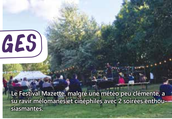
Le Festival Mazette, malgré une météo peu clémente, a su ravir mélomanes et cinéphiles avec 2 soirées enthousiasmantes.