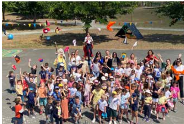
L'Accueil de loisirs et ses 13 animatrices et animateurs ont reçu une centaine d'enfants par jour au cours du mois de juillet et des 2 dernières semaines d'août.