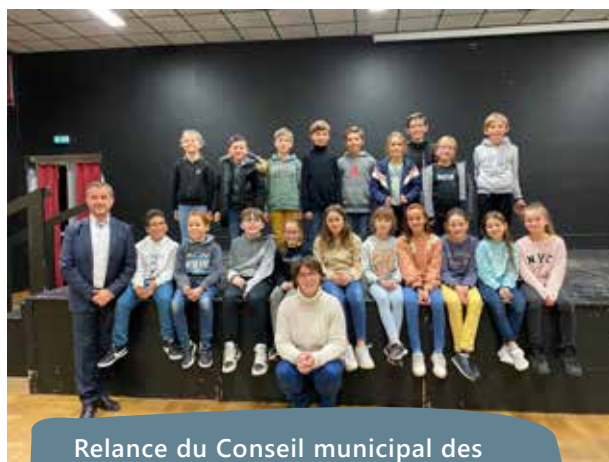
Relance du Conseil municipal des enfants 20 jeunes conseillers des classes de CM1/CM2 du territoire se sont engagés à l'automne dernier au service de la commune.