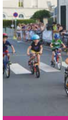
Le samedi 8 juillet, les cyclistes ont affrontés sur le circuit...