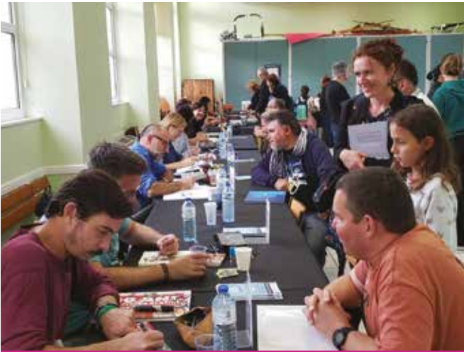
Le 24 septembre, La Bulle fêtait ses 10 ans avec un salon BD qui a su trouver son public !