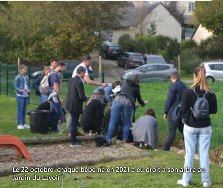
Le 22 octobre, chaque bébé né en 2021 a eu droit à son arbre au Jardin du Lavoir !