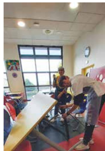
Le dispositif argent de poche pour les 16-18 ans s'est poursuivi pendant les vacances d'automne. Retour des missions prévu lors des vacances d'hiver !