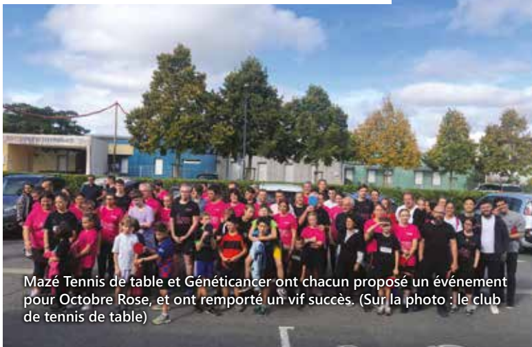
Mazé Tennis de table et Généticancer ont chacun proposé un événement pour Octobre Rose, et ont remporté un vif succès. (Sur la photo : le club de tennis de table)