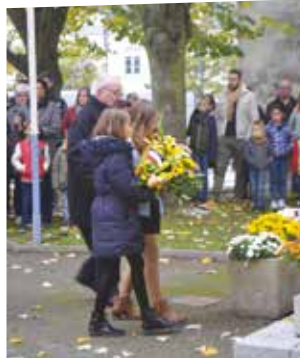
Le Conseil Municipal des Enfants était aux côtés des élus et des Anciens combattants lors de la cérémonie de commémoration de l'armistice.