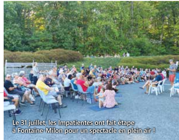
Le 31 juillet, les Impatientes ont fait étape à Fontaine-Milon pour un spectacle en plein air !