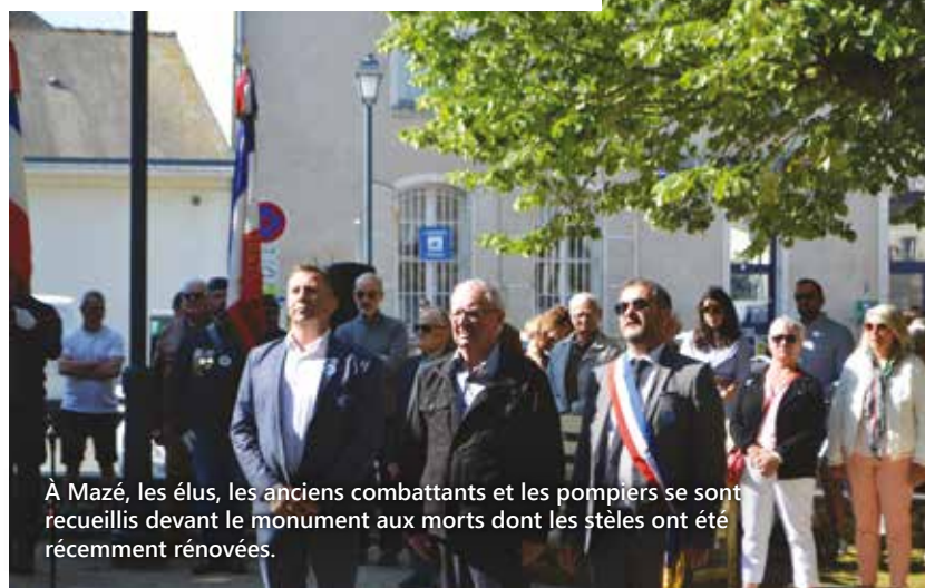
À Mazé, les élus, les anciens combattants et les pompiers se sont recueillis devant le monument aux morts dont les stèles ont été récemment rénovées.