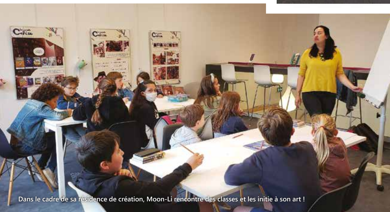
Dans le cadre de sa résidence de création, Moon-Li rencontre des classes et les initie à son art !