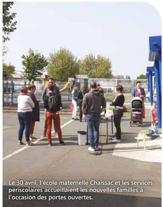
Le 30 avril, l'école maternelle Chaissac et les services périscolaires accueillent les nouvelles familles à l'occasion des portes ouvertes.