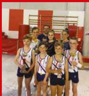
Les gymnastes filles et garçons de Mazé réunis lors de la Coupe de l'Avenir et de la Coupe Jean-Claude Bréger les 7 et 8 mai derniers.

Après 2 années sans concours, les filles et les garçons de la Jeanne d'Arc Mazé Gymnastique réalisent une très bonne saison en termes de palmarès. En effet, depuis le mois de décembre, les concours s'enchaînent entre département et région aussi bien en équipe qu'en individuel avec à chaque fois de bons résultats et des podiums sur toutes les dates. La JA Mazé Gym sera aussi représentée en individuel et par équipe sur des championnats nationaux féminins en mai et juin. Le traditionnel concours interne pour les garçons a eu lieu quant à lui cette année en mai. Le club organisera des portes ouvertes fin juin pour faire découvrir la gymnastique à tous, dès 2 ans ½ jusqu'à 77 ans. N'hésitez pas à venir nous rencontrer à la salle de gym tous les soirs de la semaine et le samedi matin.