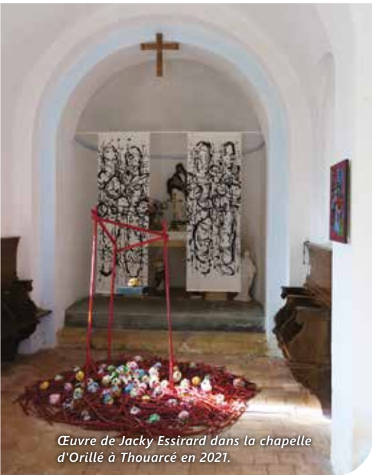
Œuvre de Jacky Essirard dans la chapelle d'Orillé à Thouarcé en 2021.