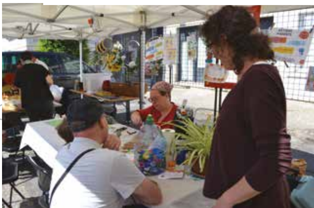
Les exposants ont trouvé leur public lors de Mon Jardin, Ma Ville le 15 mai dernier