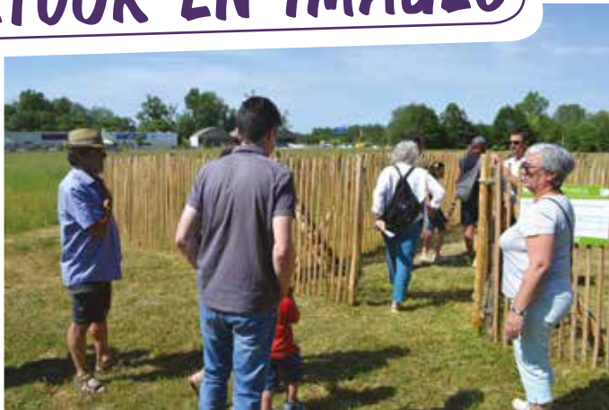
Mon Jardin, Ma Ville a été l'occasion de visites guidées du nouvel éco-pâturage du Léard.