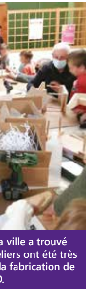
La ville a trouvé... ...ont été très... ...la fabrication de... ...