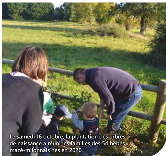
Le samedi 16 octobre, la plantation des arbres de naissance a réuni les familles des 54 bébés mazé-milonnais nés en 2020.