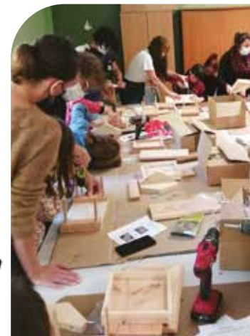
Pour sa 2 e édition, Mon jardin, Mon public ! Tous les stands et ateliers fréquentés, comme par exemple les mangeoires à oiseaux avec la LPC

Le programme d'animation s'appuie sur la foisonnante action culturelle de La Bulle et se décline en fonction des âges. Il permet aux jeunes lecteurs de découvrir des univers artistiques à travers les expositions accueillies, mais aussi d'avoir la chance de rencontrer des auteurs et des illustrateurs en chair et en os ! Les accueils de groupe se déroulent sur la journée du jeudi : 4 créneaux sont proposés sur lesquels les enseignants peuvent s'inscrire au minimum 15 jours à l'avance. Chaque classe peut s'inscrire à 3 animations par an ! D'autres services, comme des sélections à la demande, un fonds « dys », ou encore des malles pédagogiques ou de livres animés, complètent cette offre déjà exceptionnelle aux publics scolaires.