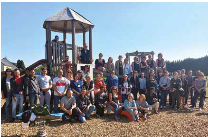
Le 22 septembre, le personnel communal a participé à une matinée de travail avec des ateliers thématiques, et aussi beaucoup de convivialité.