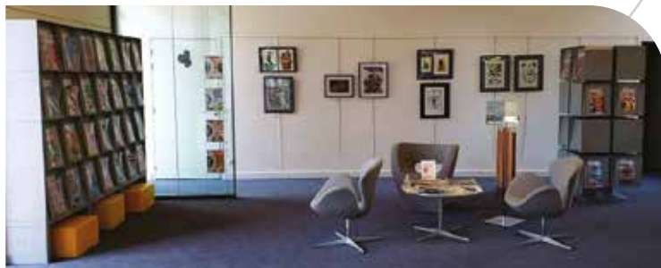
A la Bulle, l'équipe et le service bâtiments ont collaboré pour réorganiser l'espace Presse, désormais plus clair, plus lisible, et moins encombré !