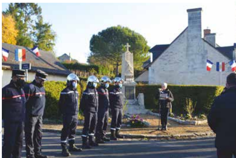
Mazéais et Milonnais ont célébré lors de 2 cérémonies l'armistice de la Guerre 1914-1918.