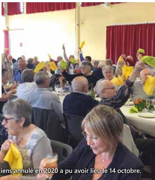
Le repas des anciens annulé en 2020 a pu avoir lieu le 14 octobre.