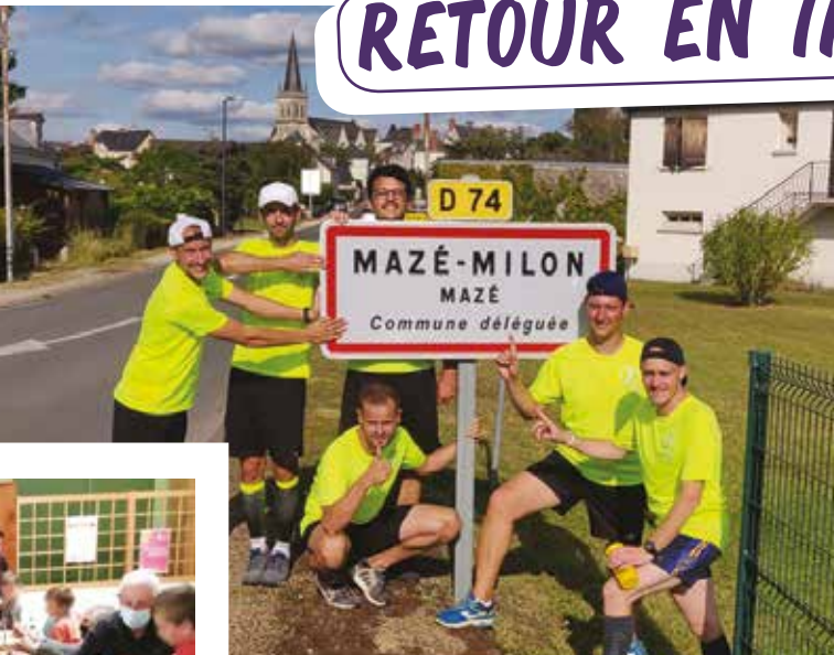
Le 11 septembre, deux « courumeurs » ont rallié Mazé en partant du May-sur-Èvre pour lever des fonds pour la lutte contre le cancer et les enfants hospitalisés.